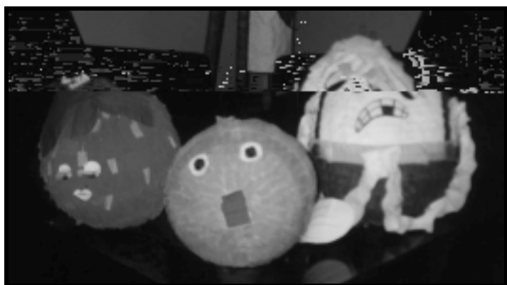
Las piñatas hermosísimas: una fresa, un pez, y "Campeón"