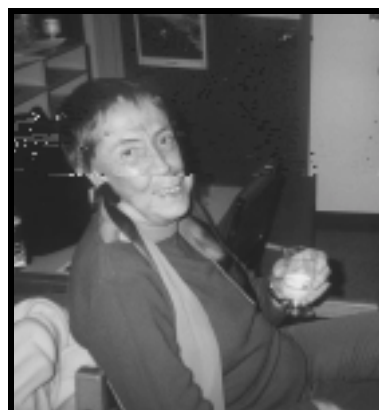
Angélica Gorodischer, famosa escritora argentina